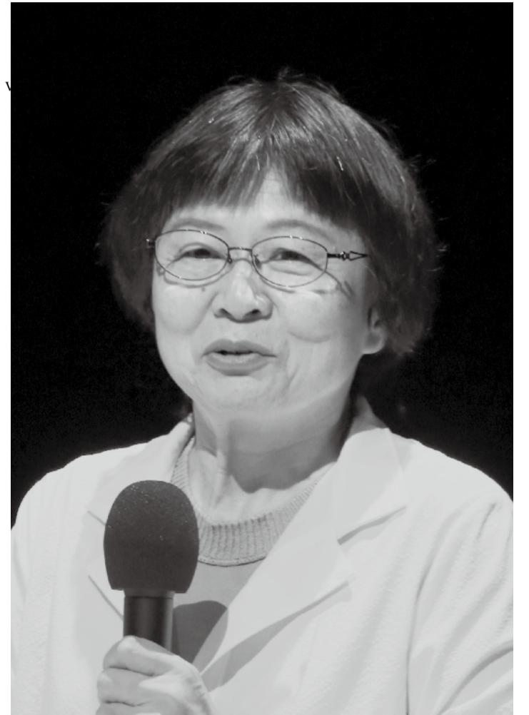
独立行政法人 地域医療機能推進機構 桜ヶ丘病院 院長